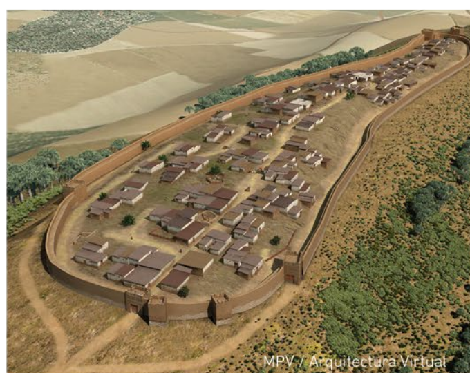
MPV / Arquitectura Virtual

Les façanes i els espais interiors es llüïen i s'emblanquaven. Els sostres eren plans, amb lleus pendents per a facilitar el desguàs, i eren accessibles per a dur a terme labors quotidianes. Veureu que en una part està la llar per a calfar-se i cuinar, que era el centre de reunió i símbol de la vida en família. Un altre espai és per a la mòlta, el treball del metall o el tèxtil junt amb diverses labors artesanies. Als rebosts s'emmagatzemaven i conservaven els productes agraris.